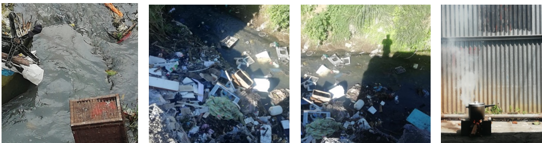
Concientización comunal problemática de la basura y contaminación de los ríos.

Como expectativas para mantener y hacer crecer el proyecto, se buscan fondos y patrocinios para establecer una sede física en otra zona en colapso con esas problemáticas sociales y culturales que originaron el MP&T, en la periferia cultural, que pueda ayudar a artistas de esos lugares a insertarse en el área artística además de realizar exposiciones de arte contemporáneo que sirvan como un espejo donde se vea el habitante de esas comunidades regenerando y reflexionando sobre el rol o designi del arte para el crecimiento humano.