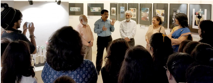
Dirty Money en Indore, India Academy IPS. 12 octubre se 2019, dirigida por Amit Ganjoo