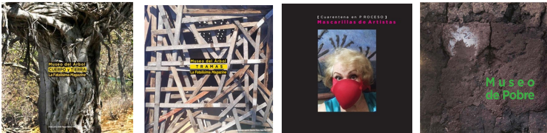
algunas otras muestra virtuales y físicas curadas por el colectivo