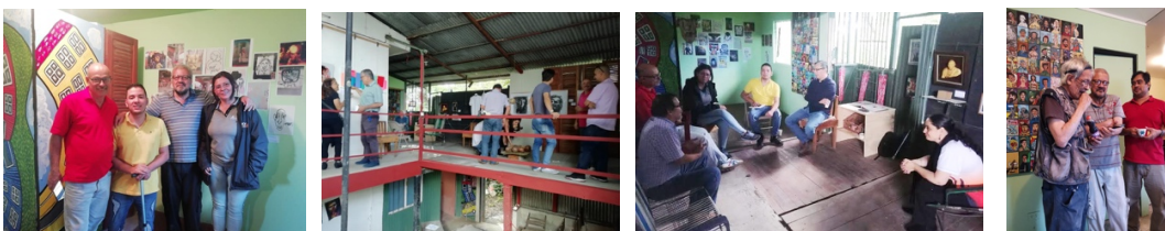
Visitas y reuniones en Ipés.

Para diciembre 2019 enero 2020 se montó Face-NO-book Identidades Invasoras, una radiografía de la crítica situación del entorno, la cual versó en esas imágenes que pululan