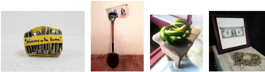
Muestra Dirty Money. Octubre- noviembre 2019.