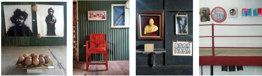
Muestra FaceNObook Diciembre2019-enero 2020.